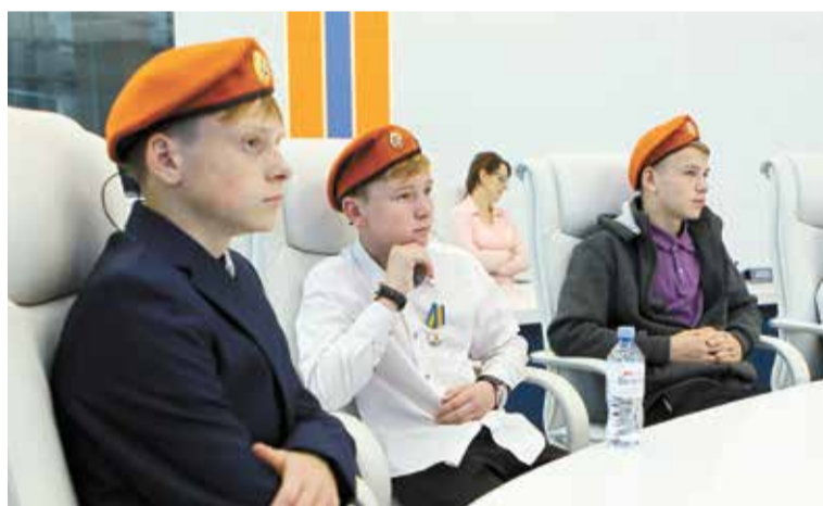
В НЦУКС МЧС России — юная смена

в Российской Федерации, а также необходимости учитывать в работе положительный опыт по профилактике гибели детей.