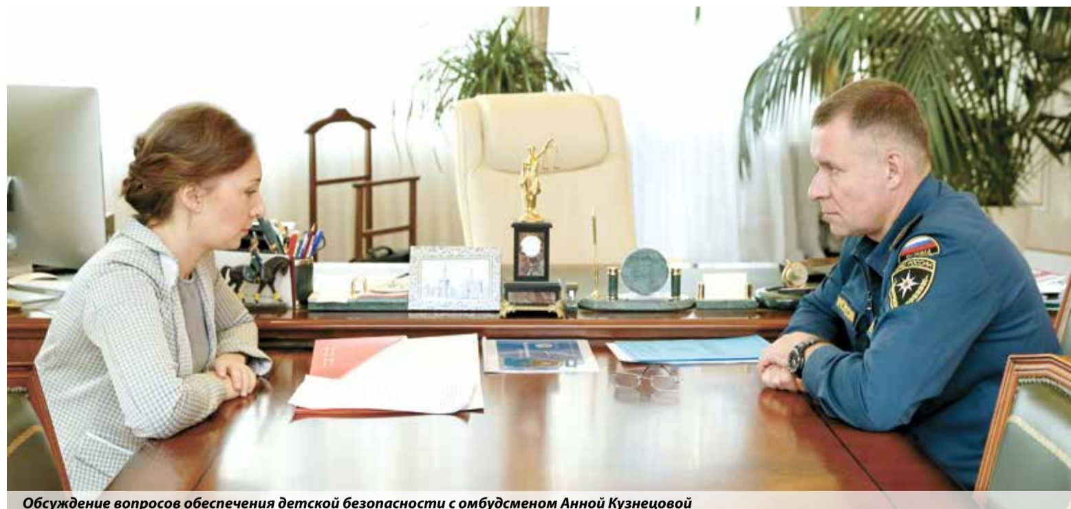
Обсуждение вопросов обеспечения детской безопасности с омбудсменом Анной Кузнецовой

Евгений Зиничев в почетной книге написал: «Мальчишки и девчонки, проявившие решимость и отвагу в сложных ситуациях, вызывая восхищение! Они совершили поступки, которые по плечу не каждому взрослому. Отдельные слова благодарности — родителям, педагогам и всем тем, кто воспитал ребят неравнодушными и смелыми, добрыми и отзывчивыми. Дорогие ребята, мы, сотрудники МЧС России, бесконечно гордимся вами. Уверен, что ваше чувство сопереживания, ваше личное мужество останутся с вами и во взрослой жизни. Пусть вас всегда сопровождают целеустремленность и вера в себя. Выражаю вам свою признательность, желаю и впредь оставаться яркими и увлеченными людьми, совершенствовать свои знания и навыки, проявлять себя с лучшей стороны, совершая добрые поступки».