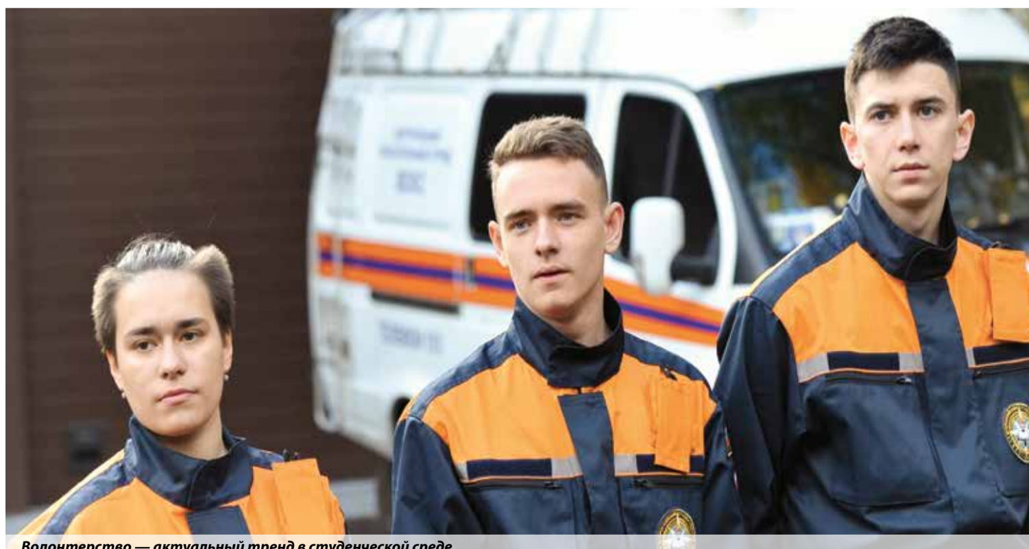
Волонтерство — актуальный тренд в студенческой среде

Всероссийский студенческий корпус спасателей был создан 22 апреля 2001 года. В его структуру входят студенческие спасательные отряды из 74 регионов России. Нет никаких сомнений, что совместная работа волонтеров и сотрудников МЧС будет продолжена.