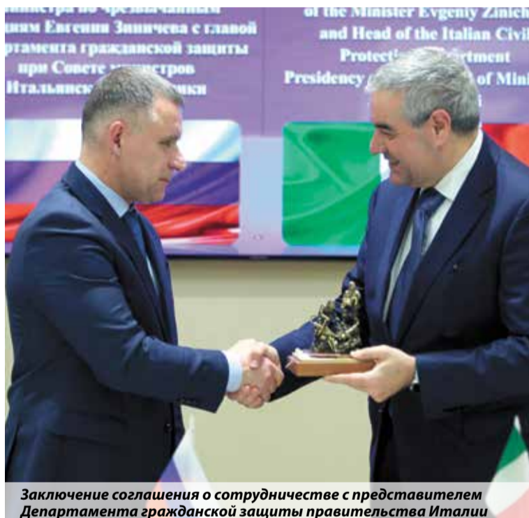
Заключение соглашения о сотрудничестве с представителем Департамента гражданской защиты правительства Италии

экономический союз, ОДКБ — государства бок о бок решают актуальные вопросы. Наше взаимодействие в области защиты населения и территорий от чрезвычайных ситуаций — еще один пример такого сотрудничества.