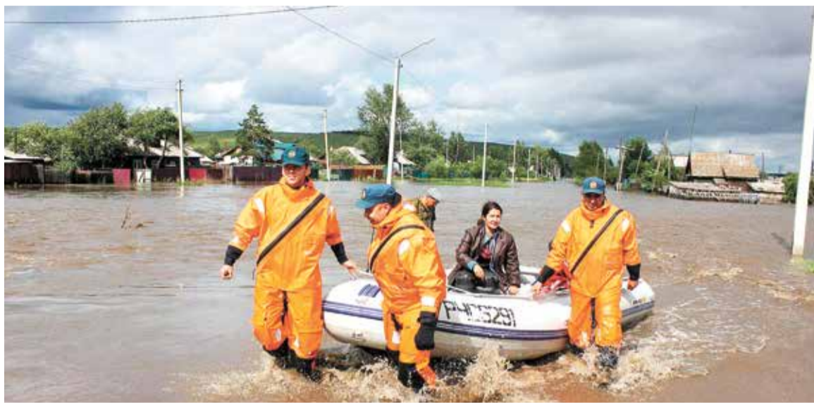
Наводнение в Забайкалье, 2018