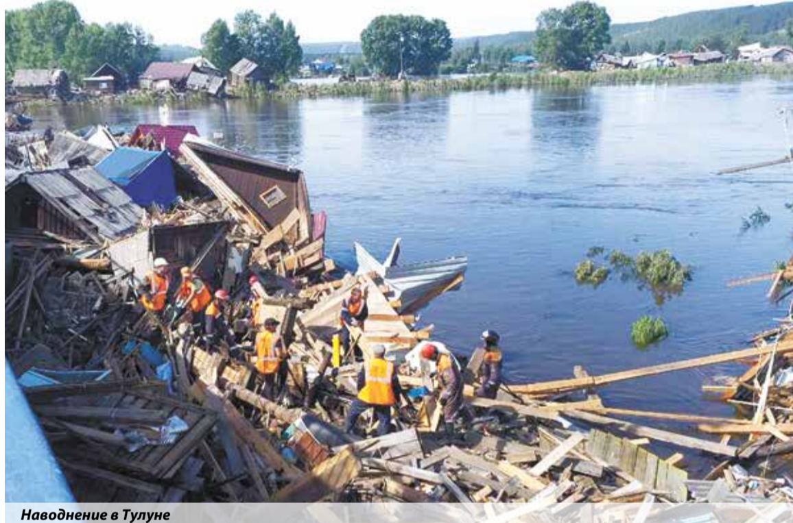
Наводнение в Тулу

гетовичем Шойгу. Есть связи внутри, есть иерархия системы. Я — такой же ее элемент, как и все, но со своей функциональной задачей. Если система устойчива, то не имеет большого значения, кто будет министром.