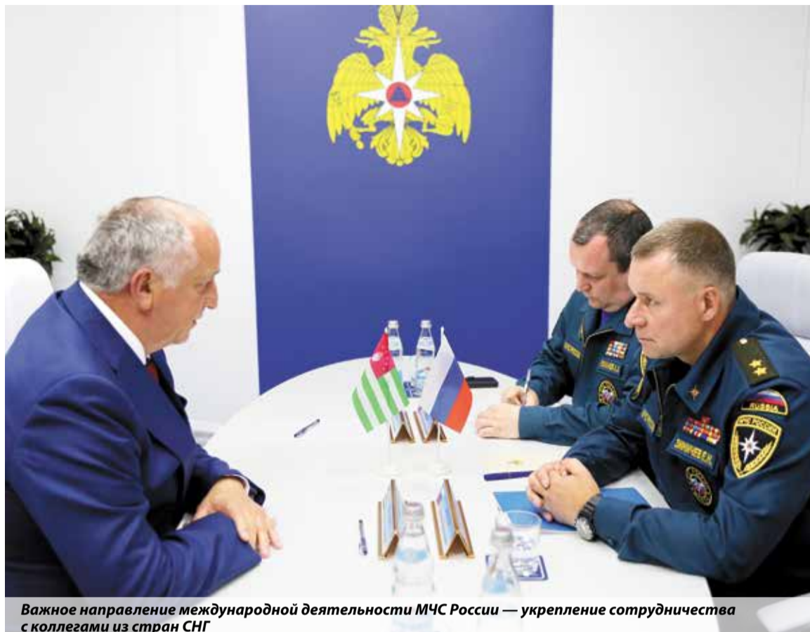
Важное направление международной деятельности МЧС России — укрепление сотрудничества с коллегами из стран СНГ

— Во всех существующих форматах — СНГ, Евразийский