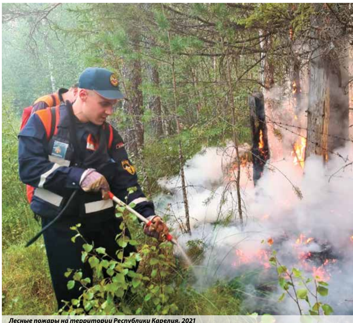
Лесные пожары на территории Республики Карелия, 2021