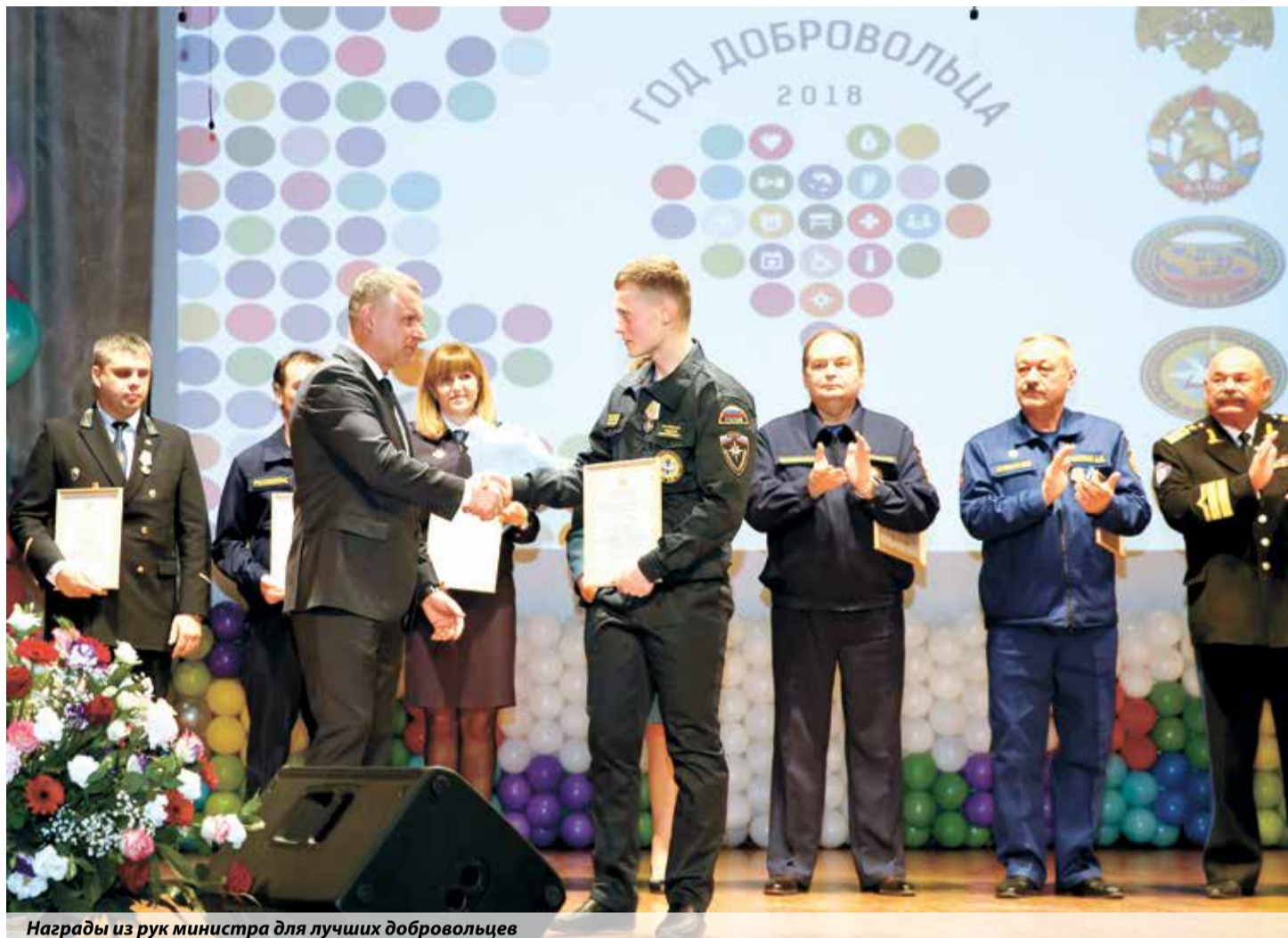
Награды из рук министра для лучших добровольцев