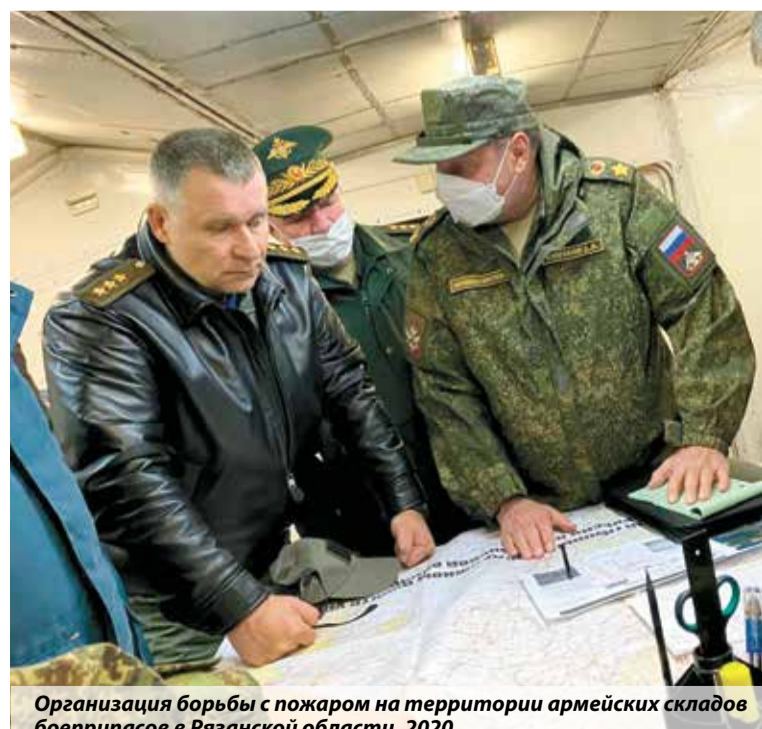
Организация борьбы с пожаром на территории армейских складов боеприпасов в Рязанской области, 2020