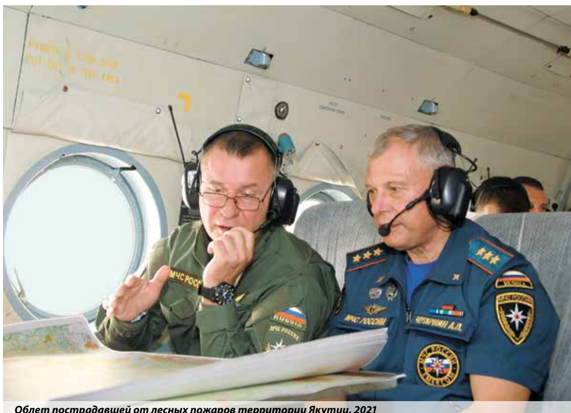
Облет пострадавшей от лесных пожаров территории Якутии, 2021