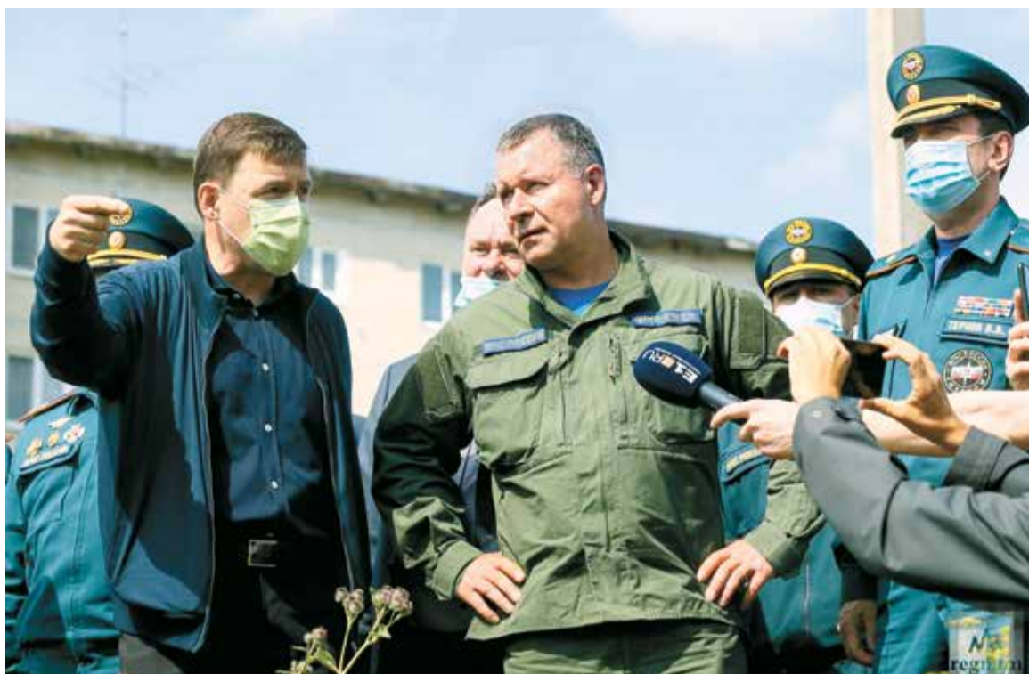
Ликвидация последствий подтопления города Нижние Серги Свердловской области, 2020

В рамках рабочей поездки Евгений Зиничев совместно с главой Республики Саха (Якутия) Айсеном Николаевым оценил с воздуха лесопожарную обстановку на территории Горного района, где складывалась наиболее серьезная ситуация.