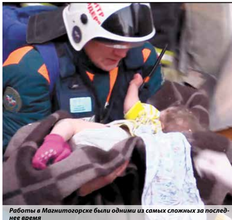
Работы в Магнитогорске были одними из самых сложных за последнее время

Надо понимать, есть дамбы, которые рассчитаны на определенный подъем воды. Дамба, построенная в Тулуне, была изначально рассчитана на больший подъем воды, чем это было при предыдущих подтоплениях. Поэтому прогнозы поначалу не вызывали