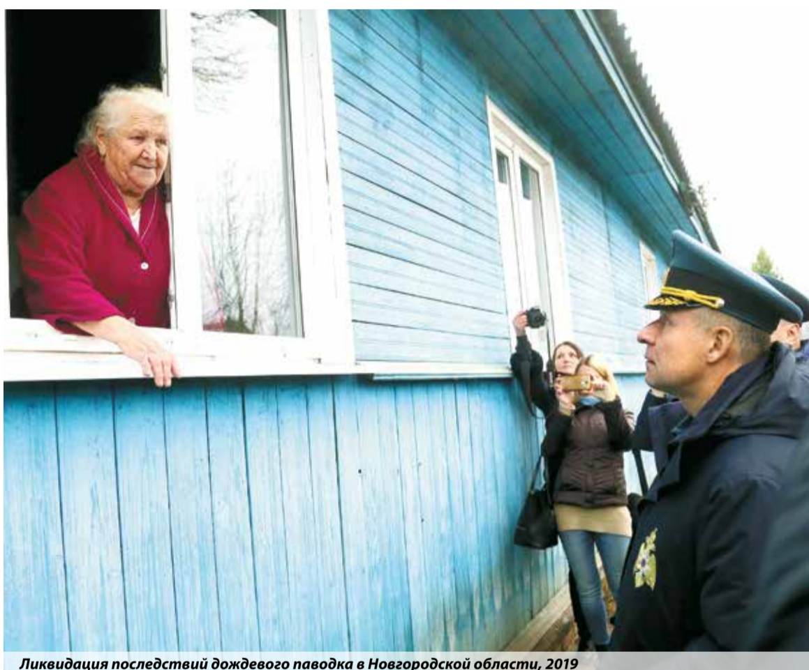
Ликвидация последствий дождевого паводка в Новгородской области, 2019

В частности, пояснил руководитель чрезвычайного министерства, для защиты от воды использовались возведенные в экстренном порядке заграждения из мешков с песком, а надо вместо них там, где есть возможность, заранее устанавливать защитные сооружения и возводить стационарные дамбы.