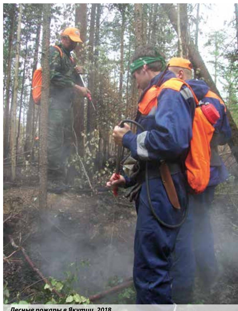
Лесные пожары в Якутии, 2018

Евгений Зиничев побывал в Усть-Кутском районе Иркут-