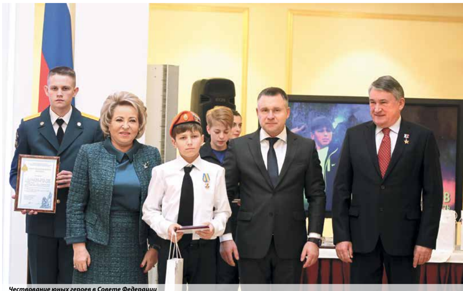
Чествование юных героев в Совете Федерации

Евгений Зиничев и Анна Кузнецова уделяли особое внимание обсуждению вопросов совершенствования концепции преподавания предмета «Основы безопасности жизнедеятельности»